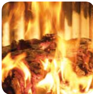
Luftzufuhr erst drosseln, wenn sich ein schöner Glutstock gebildet hat.