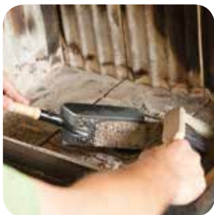
Den Ofenraum von Asche säubern.