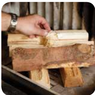
Anzündhilfe auf den Brennholzstapel legen.