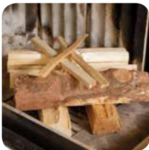
Holzspäne gekreuzt darüber platzieren.