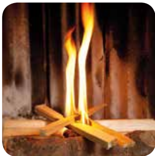
Durch ausreichend Luftzufuhr rasch helle, hohe Flammen herstellen.