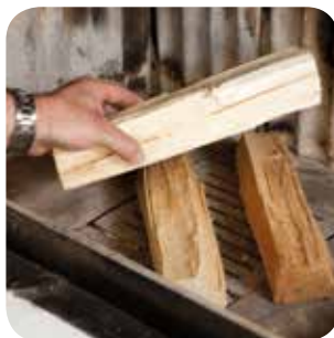
Das Holz locker in den Brennraum schichten.