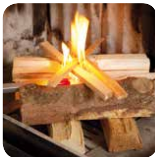
Von oben anzünden.