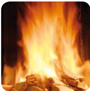
Ein kräftiges Feuer garantiert einen guten Abbrand.