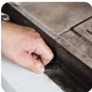
Luft- und Drosselklappen ganz öffnen.